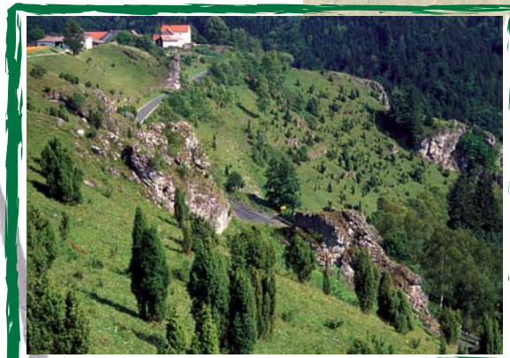
Wacholderheide bei Wallersberg im Kleinziegenfelder Tal