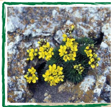
Das Immergrüne Felsenblümchen (Draba aizoides) blüht im zeitigen Frühjahr an sonnigen Felsen.

Mit einer einmaligen Freistellungsaktion ist es nicht getan. Überlässt man die Felsen und Hänge wieder sich selbst, so hat sich in einigen Jahren die Ausgangssituation wieder eingestellt. Deshalb wird in den kommenden Jahren die Folgepflege bereits freigelegter Felsen und Hänge der Schwerpunkt des Naturparkprojektes sein.