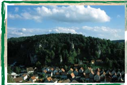
Felsen bei Pottenstein vor und nach der Freilegung

Zunächst wurde von qualifizierten und erfahrenen Fachkräften ein Konzept entwickelt, welches festlegte, wo und in welchem Umfang Freistellungen erfolgen sollten. Es wurde eine Prioritätenliste der Einzelmaßnahmen sowie eine Kostenschätzung erstellt. Unter regem Interesse der Gemeinden und tatkräftiger Unterstützung durch die zuständigen Behörden, Vereine und Verbände sowie der gesamten Bevölkerung wurden bisher mehr als 250 Einzelmaßnahmen durchgeführt. Dabei flossen über 700.000 Euro an Fördermitteln des Freistaates Bayern und der Europäischen Union in das Vorhaben ein. 40 Gemeinden von Weismain im Landkreis Lichtenfels bis Pommelsbrunn im Landkreis Nürnberger Land sind heute an dem Modellprojekt beteiligt.