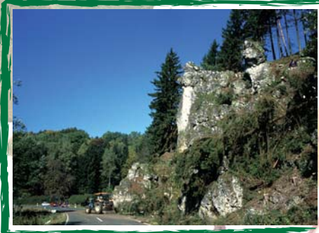
Felsfreilegung im obersten Wiesenttal zwischen Freienfels und Neidenstein

Nachdem bereits seit Beginn der achtziger Jahre gelegentliche Felsfreilegungen erfolgten, wurde 1996 das Modellprojekt „Fels- und Hangfreilegungen“ im Naturpark Fränkische Schweiz - Veldensteiner Forst mit dem Naturparkverein als Planungsträger in Angriff genommen.