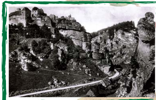
Burg Rabenstein im Ailsbachtal um 1930 (oben) und etwa 50 Jahre später (unten).

Vor knapp zweihundert Jahren, zur Zeit der Romantik, gerieten Dichter wie Ernst Moritz Arndt oder Viktor von Scheffel über diese Landschaft ins Schwärmen. Seither werden jährlich unzählige Ausflügler und Touristen von der Fränkischen Schweiz angezogen.